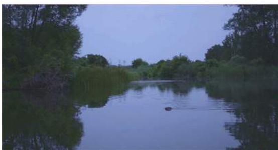
6. Szene aus »The Setting«, NARRATION (2016)