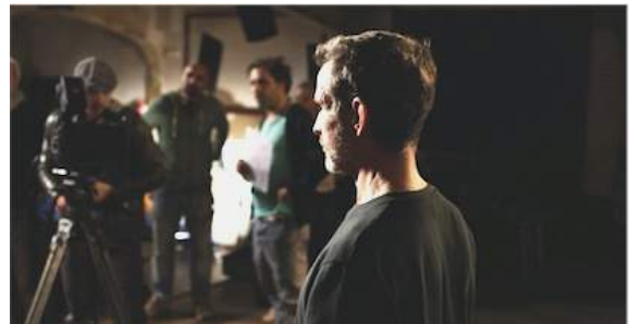
3. Szene aus »The Narrator« mit Ulrich Matthes NARRATION (2016) © Thomas Taube