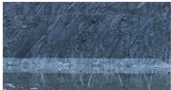
13. Szene aus »The Setting« NARRATION (2016) © Thomas Taube